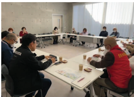
保護司との意見交換会