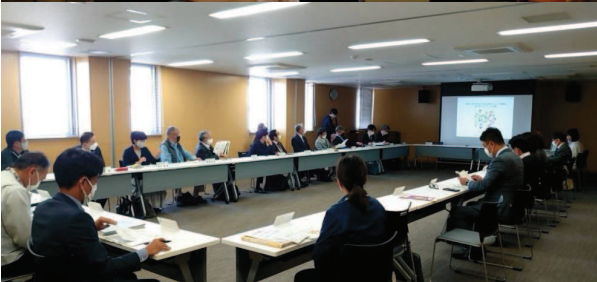
第4回(参加30名)体制整備