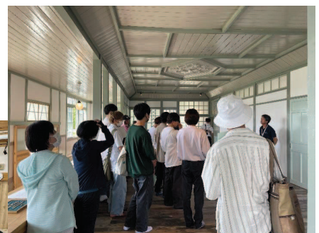
大学連携 (空き家前夜調査)

※福祉のキーパーソンが異なる分野を知り、新たに発見・気づき、アプローチが広がるのが重要