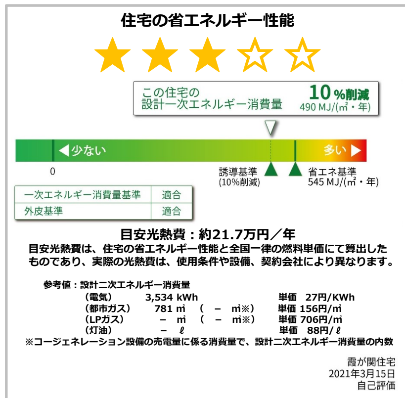
ラベルイメージ（詳細ページ等に掲載）