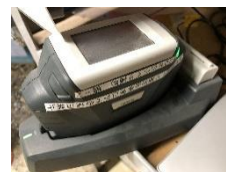
塗装ブース (右) ⇨ 調色システム (左)