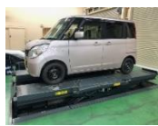
リンク式ドライブオンリフト