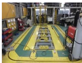
三次元車両測定装置