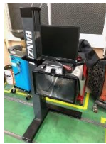
ヘッドライトテスター