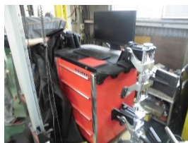
ホイールアライメントテスター