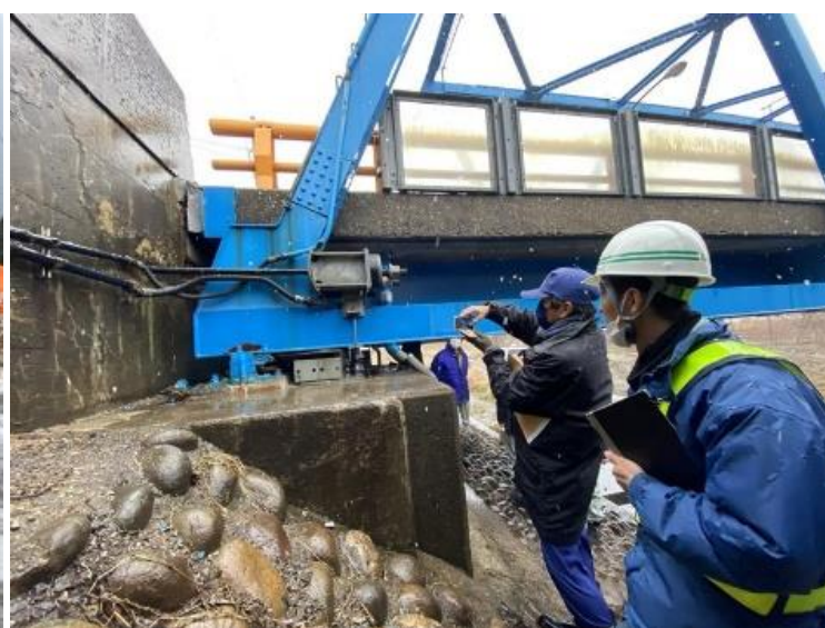
緊急調査状況(新庄川橋)