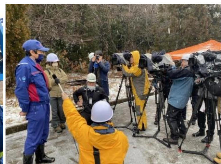
取材対応状況(国道359号)