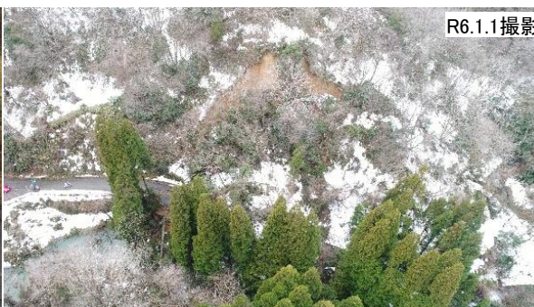
一般県道仏生寺太田線(氷見市)