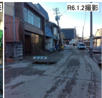
市道伏木国府伏木中央線(高岡市)