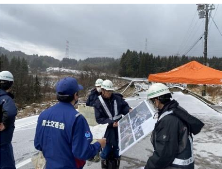
緊急調査状況(国道359号)