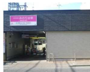
みのり台駅耐震補強