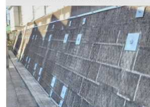
松戸新田駅土留め壁補強