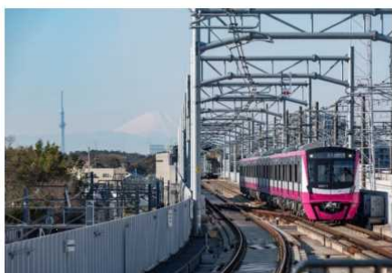
北初富駅～新鎌ヶ谷駅間