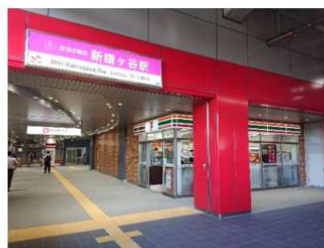
新鎌ヶ谷駅出入口