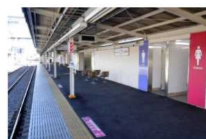
前原駅ホーム内方線