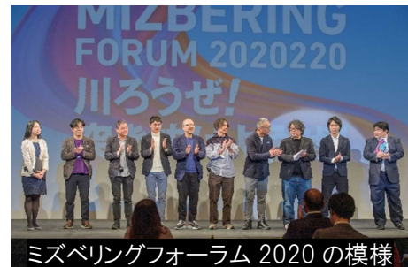
ミズベリングフォーラム 2020 の模様

国際的スポーツイベントや感染症等も経験した今、改めて振り返り、水辺はどう変わったのでしょうか。本フォーラムでは、全国の水辺の先進的な取組事例や取り組むべき水辺のアイデアを共有するインスパイアセッション、およびいま向き合うべき水辺の本質的価値を共有するトークセッションを通して、今後わたしたちが向き合う大きな変化を捉えます。