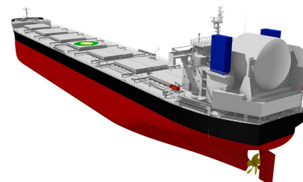
LNG燃料ばら積み貨物船「KAMSARMAX GF」イメージ

<実施場所> 常石造船(株) 常石工場 (広島県福山市) 神田ドック(株) 川尻工場・若葉工場(広島県呉市)