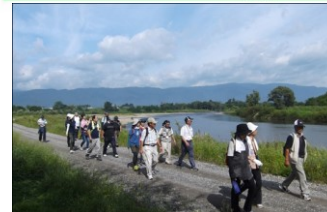
河川管理用通路の利用 (最上川/長井市)