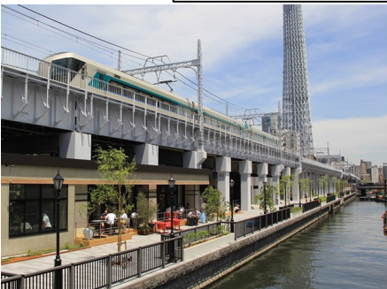
民間事業者との連携 (北十間川/墨田区)