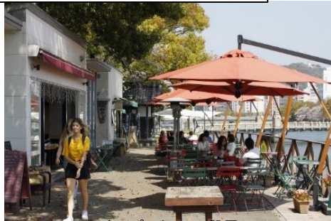
オープンカフェの設置 (京橋川/広島市)