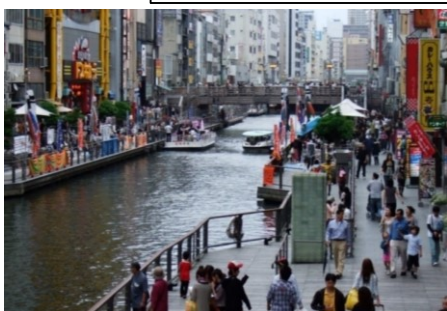
遊歩道の民間活用 (道頓堀川/大阪市)