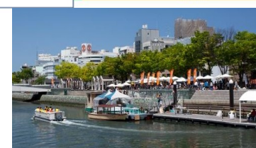
親水護岸の利用 (新町川/徳島市)