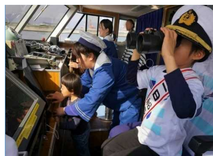
ファンタジー号では、小学生を対象に「船長体験クルーズ」を実施しています。乗組員と一緒に操舵室で船長のお手伝いなど、貴重な体験ができます。

現在、育児休業中の女性乗組員がいますが、いつでも復帰できるよう、これからも女性の活躍推進のため、職場環境の改善と生活環境の整備に努め、魅力ある職場にしていきます。