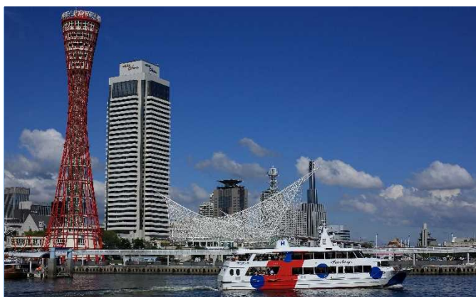
青い海原と潮風を感じる木張りのデッキ。陽光のさしこむラウンジ。明るく清潔な船内のファンタジー号は、女性の船員で運航しています。