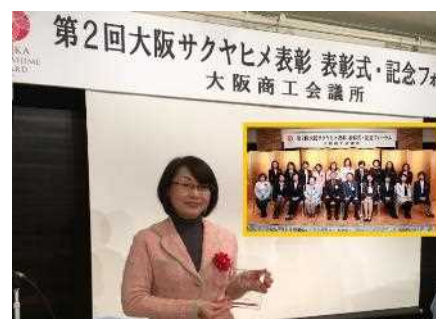
平成29年度「第2回サクヤヒメ表彰」受賞式典にて。（女性管理職員）

平成29年には、大阪商工会議所主催の、企業活動や文化的活動で活躍する女性リーダーを応援する“第2回大阪サクヤヒメ表彰”にて、当社の女性管理職員が活躍賞を受賞しています。