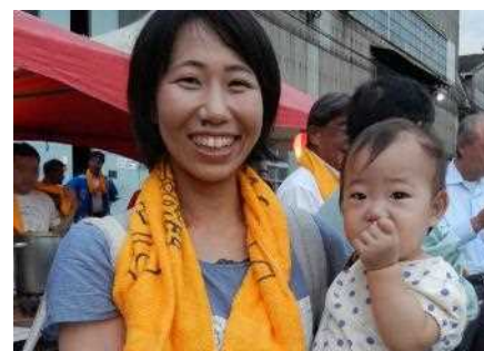
現在子育て中の設計職の女性社員。

また、フレックスタイム制度を活用することで、育児休暇を取得後に復帰してからも、就業時間を調整して働きやすい環境となっています。