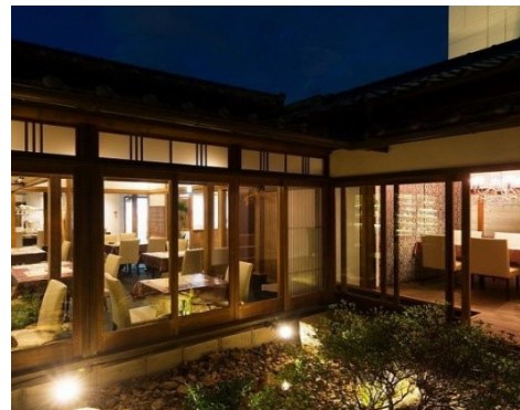
(改修後のイメージ)