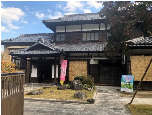
(市の施設「城下町観光交流館」)