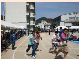
地域行事への参加