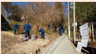
地域清掃活動への参加