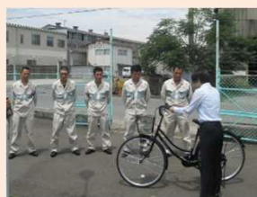
自転車マナー教育