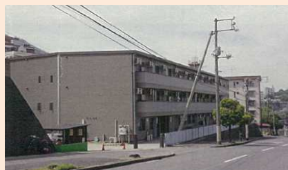
工場に近接する寮（外観）