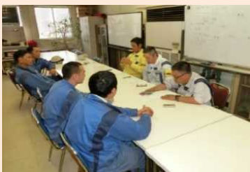
会社スタッフによる面談