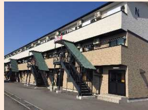
新設した外国人専用の寮 (外観)