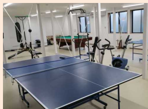
寮には卓球場・ビリヤード場・トレーニングジムを完備