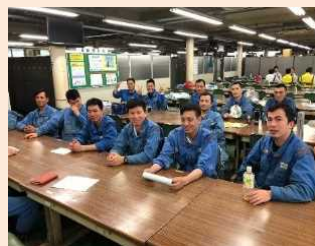
安全教育講習に臨む実習生