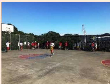
バスケットコートの整備