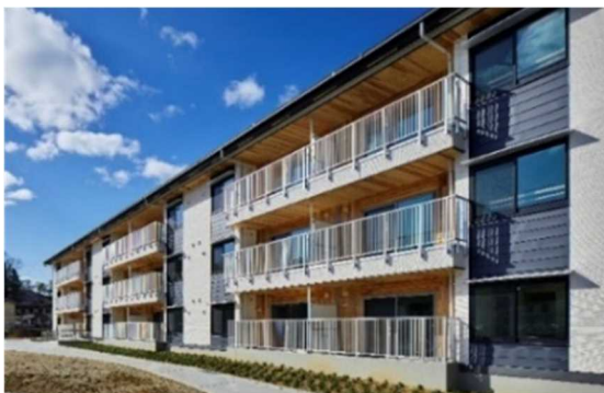
CLTパネル工法による公営住宅 (福島県復興公営住宅 磐崎団地)