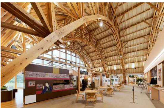
定尺材アーチトラスによる大空間 (能代市 道の駅ふたつ)