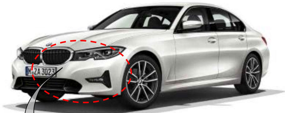
図：左ハンドル仕様