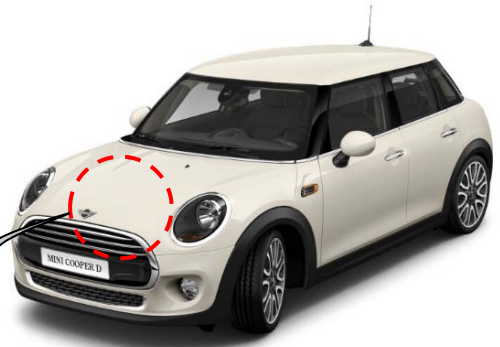
写真は左ハンドル車