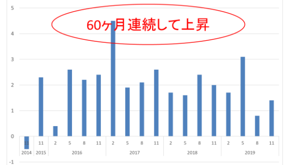
住宅の不動産価格指数 前年同月比の推移

〈問い合わせ先〉土地・建設産業局不動産市場整備課 課長補佐 安保（内線 30-222） 森山・山田（内線 30-214） (代) 03-5253-8111 (直) 03-5253-8375 (FAX) 03-5253-1579