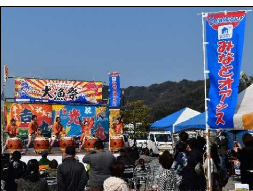
地域振興イベントの開催状況