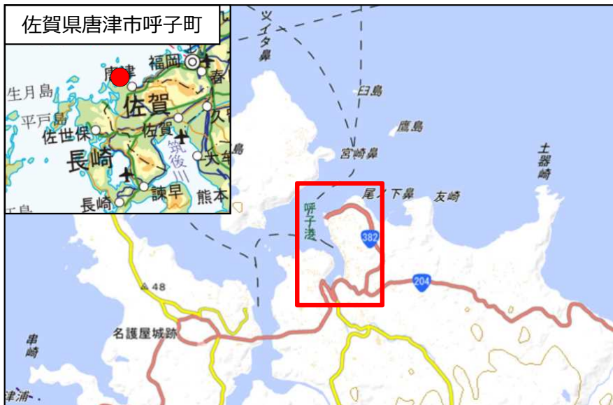
国土地理院地図（電子国土Web）( http://maps.gsi.go.jp )をもとに国土交通省作成