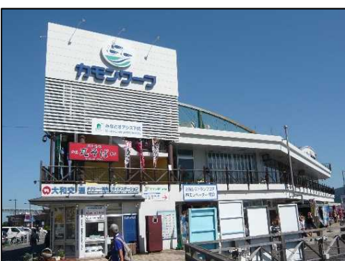
構成施設のイメージ