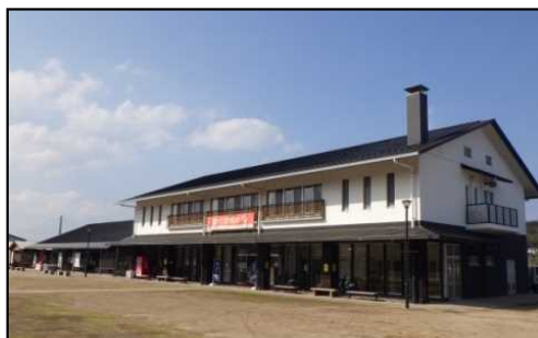
呼子台場の湯、大漁鮮華