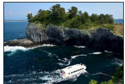
七ツ釜遊覧船「イカ丸」