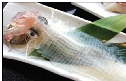
呼子名物「イカの活造り」