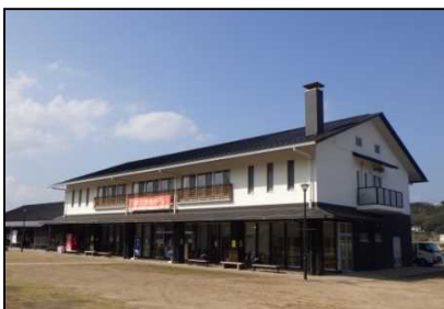
呼子台場の湯、大漁鮮華