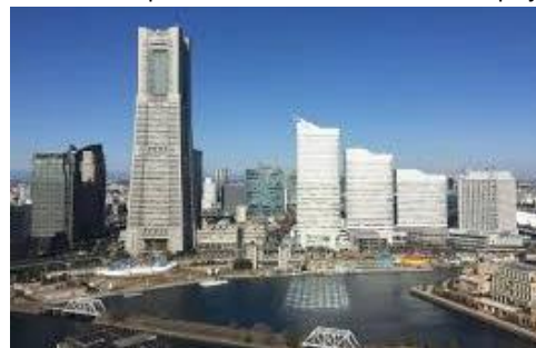
Minato Mirai 21 District (Kanagawa – Urban new town on reclaimed land)