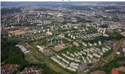
Tama New Town District (Tokyo - The largest scale of new town development in Japan)

As a group company of UR, UR Linkage is a company that supports comprehensive development of communities and housings for large-scale urban development projects in Japan, through a broad scope of services ranging from project planning/concept planning stage, actual planning/design stage, quantity survey/construction/supervision stage, and to sales/management stage. While at the same time, by cooperating with Japanese government agencies, UR Linkage has long been providing operation management of working groups of "Japanese Conference for Overseas Development of Eco-Cities (J-CODE)", in which we provide support in developing and promoting projects and conducting studies to promote Japanese companies to expand their business to emerging countries such as ASEAN regions. Following are some example of our domestic and international projects.