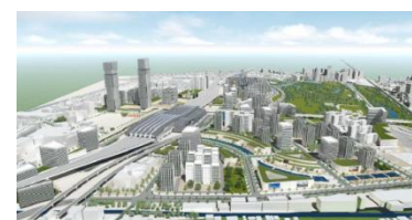
Bang Sue District (Thailand, Bangkok – Development of large-scale master plan at former factory site)