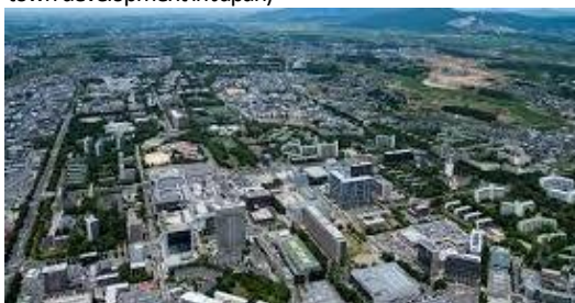
Tsukuba Science City (Ibaraki – The sole city for research and education in Japan)