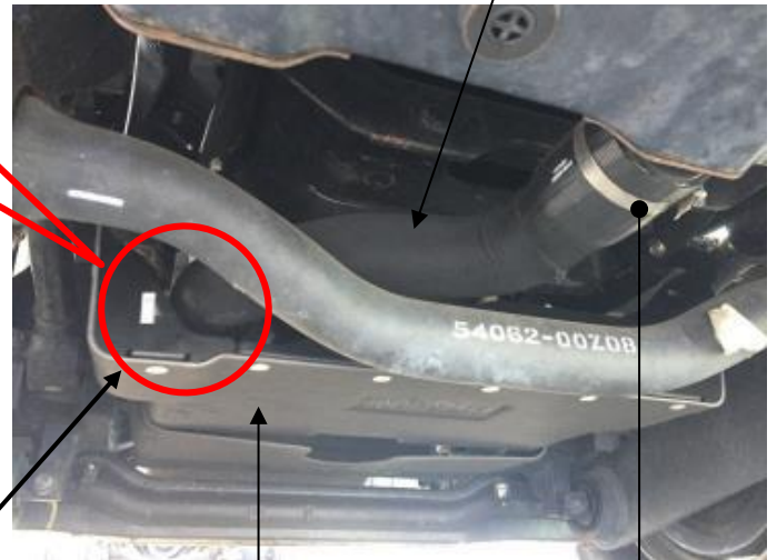
エンジンアンダーカバー