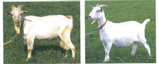
シバヤギ 左:オス、右:メス