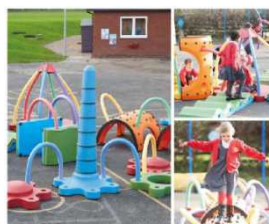
遊具の設置(イメージ)