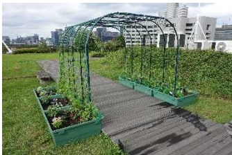
緑のカーテン設置状況

屋上庭園の活用方法として、ミスト付き緑のカーテンや遊具、テーブル・ベンチ等を設置し、憩いやコミュニケーションを図る場として緑化空間のさらなる価値の向上を提案します。