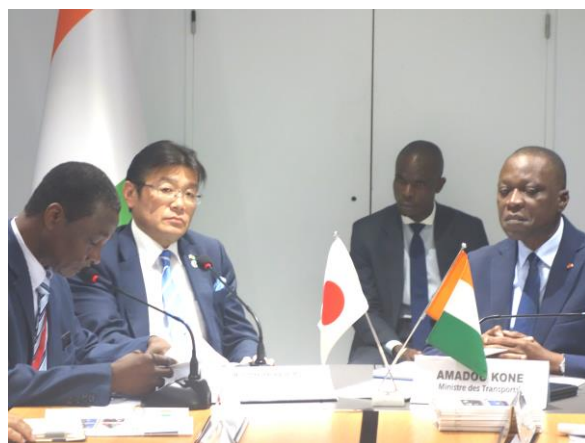
コネ運輸大臣とのバイ会談

コネ運輸大臣、クアク設備・道路整備大臣からは、日本の訪問団を歓迎するとともに、インフラをはじめとする様々な分野での我が国による支援に感謝を述べられました。特に、我が国が支援する様々な事業に触れ、渋滞緩和や道路状況改善に寄与している旨述べられました。また、TICAD7 へ参加の意向を示すとともに、さらなる日本からの投資を増加させるための協力について期待が述べられました。