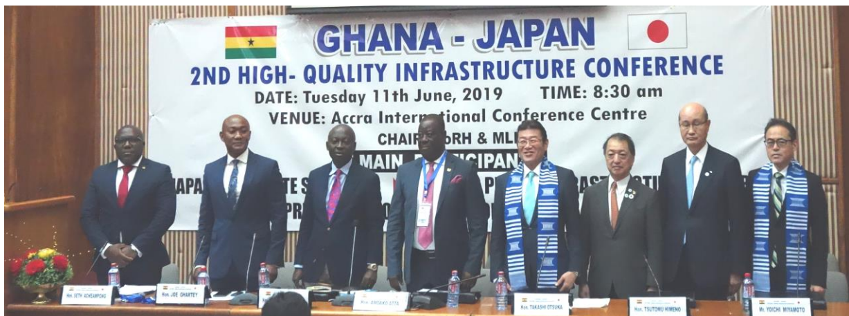
官民インフラ会議の様子

(注) TICAD: Tokyo International Conference on African Development (アフリカ開発会議)の略。アフリカの開発をテーマとする国際会議。TICAD VI(第6回アフリカ開発会議)は、2016年8月にケニア・ナイロビにて開催。TICAD 7は、2019年8月に横浜にて開催。国土交通省は、同会議において、「日・アフリカ官民インフラ会議」を主催予定。