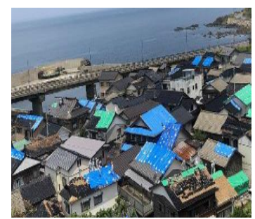
(被災地の屋根瓦の状況)

・地方自治体の財政支援について、地域の要望を踏まえ、社会資本整備総合交付金等を活用