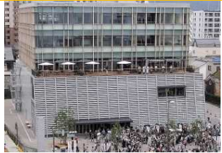
信毎メディアガーデン(H30.4オープン)