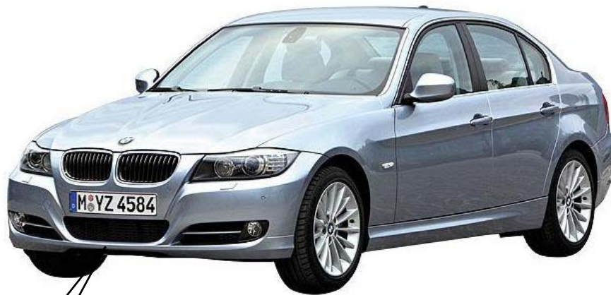
写真は左ハンドル車