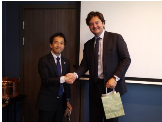
（写真左：篠原国土交通審議官、写真右：ホルテ外務副大臣）

概 要：海事政策に関する意見交換を行うとともに、日・ノルウェー間の海事分野における更なる協力関係の強化に取り組むことで一致。