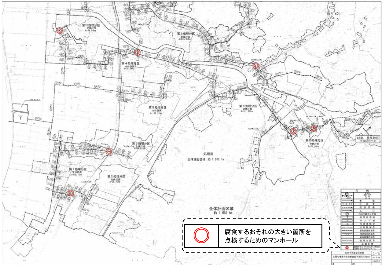
図3 主要な管渠の平面図の記載例

具体的には、平面図の中に、該当のマンホールをマークするなどして示す。例えば、下記の図3のような記載になる。「点検箇所の数」が特定できる記載方法であれば、どのような方法であってもよい。