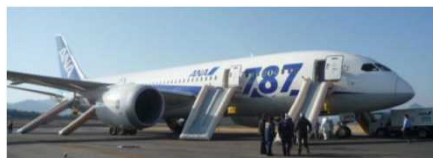
H25.1.16機内から煙が発生し、高松空港に緊急着陸し避難誘導を要した事案