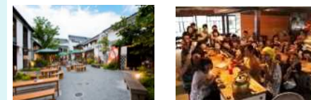
* 長野市「パティオ大門」 * 活性化施設(イメージ)