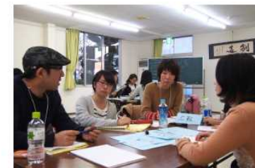
住民によるワークショップ

民間が整備すべき都市計画に定められた施設を確実に整備・維持 (都市機能をマネジメント)