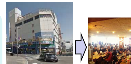
百貨店の撤退後、地元企業が転賃権・管理権を得て、商業、レストラン等の運営を継続した事例(岩手県花巻市)