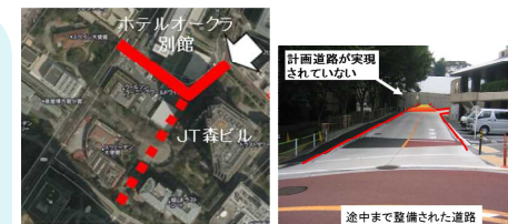
沿道の開発が計画どおりに進まず、地区施設が未整備のままとなっている事例

民間が整備すべき都市計画に定められた施設を確実に整備・維持 (都市機能をマネジメント)