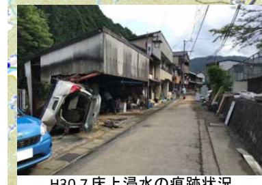
H30.7 床上浸水の痕跡状況