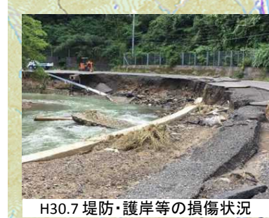
H30.7 堤防・護岸等の損傷状況

【全体計画】 河川名 : 一級河川木曾川水系津保川 事業内容 : 河道掘削 等 全体事業費 : 約48億円 事業期間 : 2019年～2023年 【平成31年度実施】 実施内容 : 河道掘削 等 事業費 : 400百万円 (国費200百万円)