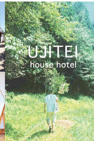
山に生花の材料を取りに行くところから始める生花体験