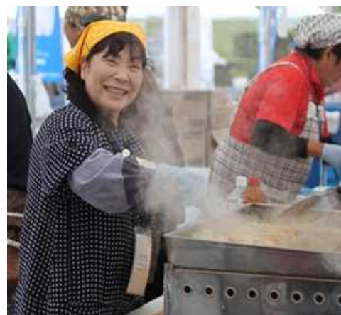
自然体で宿泊者を迎えるオーナー