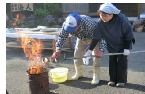
カツオのわら焼き体験