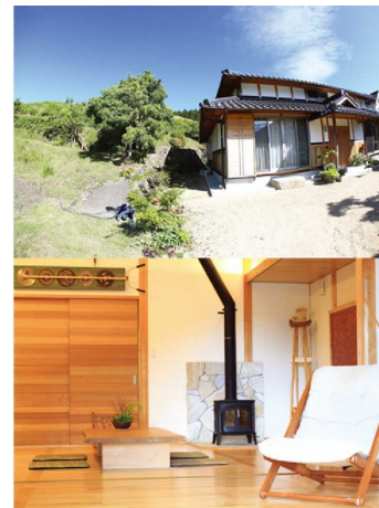
上：宿泊施設外観 下：リビング