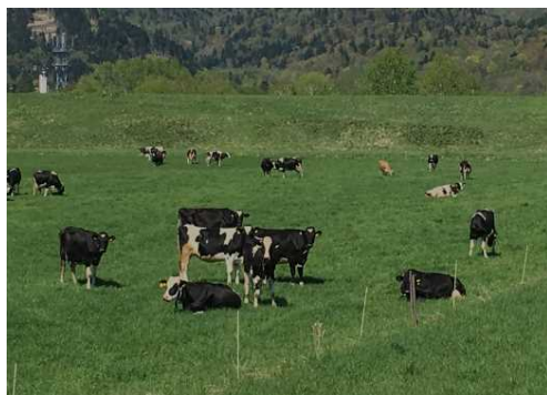
自然とのふれあい