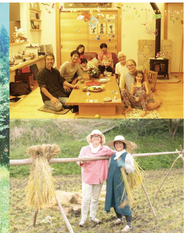
上：地域住民との交流 下：稲刈り体験