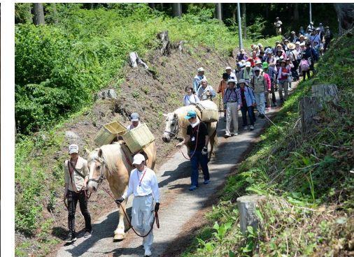
中田トレイル(散策路)における周遊体験の様子