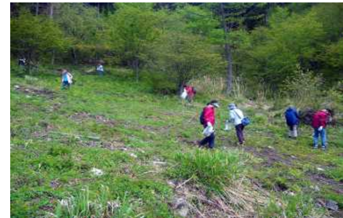
山菜トレッキング