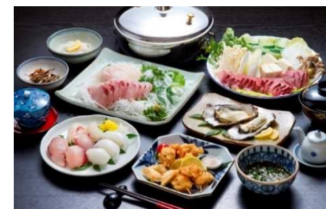
深浦港で水揚げされる四季折々の海産物