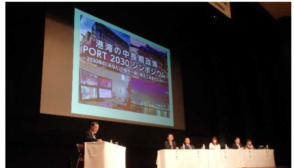
11/13 PORT 2030 シンポジウムの様子

※一般公開資料・概要報告があるもののみリンク先を掲載 ※国土交通省港湾局(本省)が外部機関に対して周知した取組を抜粋