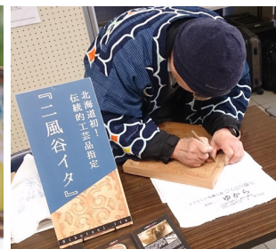
伝統的工芸品に指定された ニ風谷イタ

※取材については、事前の申込みが必要となります。別添、取材申込書により、12月12日（水）15時までにFAX・emailにてお申し込みをお願い致します。