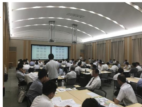
H30年度上半期 関東ブロックにおける研修会場