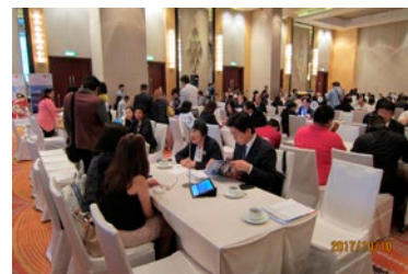
フィリピンにおける訪日クルーズセミナー