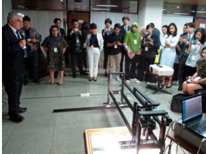
「日本ブランド発信事業」 京都大学井手亜里教授が、インドネシア、ASEAN事務局を訪問し文化財のデジタルアーカイブ技術について講演（2018年（平成30年）2月）

日本政府観光局（JNTO）は、JFの実施する国際文化交流事業や日本語教育普及事業と連携し、対日関心層の訪日旅行促進や訪日教育旅行促進を目的とした取組を実施した。