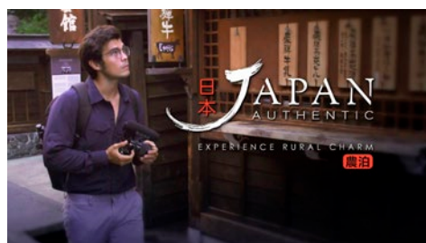
海外のタレントを起用した動画 （東南アジアのCATV放送局LiTVによる放送）

2017年度（平成29年度）に新設した農泊推進対策事業により、206地域において、「儲かる」体制の確立、古民家の宿泊施設への活用等の地域の「宝」を磨き上げる取組を支援した。また、地域の取組を「知って」もらう機会の創出のため、海外のタレントやブロガー等による国内外への発信（2017年（平成29年）6月～）、シンポジウムの開催（同年7月～）、農泊プロセス事例集の作成及び公表（同年7月）等を実施した。