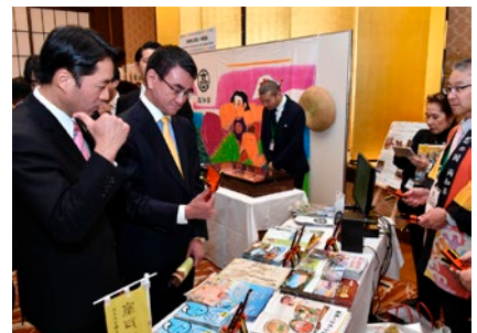
外務大臣及び高知県知事共催レセプション・ 会場内のブースを回る河野大臣と尾崎知事 (2018年(平成30年)2月)

飯倉公館を活用し、外務大臣が地方公共団体首長等と共催でレセプションを開催する取組を4件（福岡県、岡山県、高知県及び北海道）実施し、各地の特産品、地場産業、伝統芸能、伝統工芸、観光地等の魅力をPRした。