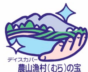
「ディスカバー農山漁村（むら）の宝」のロゴ

2017年（平成29年）6月に、熊本市においてシンポジウム及びマルシェを開催し、過去の選定地区の取組のPRを実施した。また、同年10月に第4回選定として、優良事例31地区を選定し、