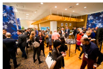
IAPCO総会に合わせ実施した、ネットワーキングイベント

2017年（平成29年）6月に開催されたICCA（国際会議協会）の研修セミナーにおいて、日本を国際会議の開催地としてPRするとともに、海外の国際会議主催者と国内MICE関係者とのグローバル・ネットワークを構築した。また、2018年（平成30年）2月に東京で開催されたIAPCO（国際PCO協会）総会に合わせ、MICEシンポジウムやネットワーキングイベントを実施し、IAPCOメンバーと日本のステークホルダーとの交流の機会を創出した。