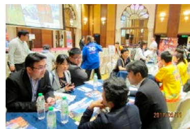
マレーシアにおける訪日クルーズセミナー