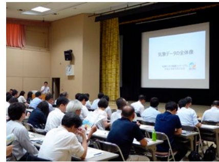
気象ビジネス推進コンソーシアムのセミナーにおける気象情報に関する説明の様子

民間事業者等が気象情報を多言語情報配信するための環境整備として、2018年（平成30年）3月に気象情報の多言語対訳リストを作成した。また、「気象ビジネス推進コンソーシアム」においてセミナーを計12回開催し、気象情報の利活用を促進した。