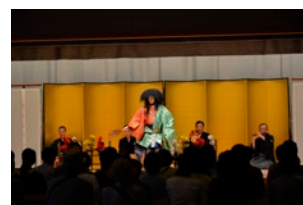
赤坂迎賓館及び京都迎賓館の一般公開の状況