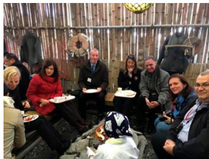
三重県伊勢志摩地域視察ツアー・海女小屋 体験で新鮮な魚介類に舌鼓を打つ外交団 (2017年(平成29年)11月)

駐日外交団等に対し、合計8の地方公共団体・地域・法人等と協力して、セミナー2件を開催し、それぞれの地方の投資誘致、観光誘致、特産品、伝産品等をPRした。また、地方公共団体等と共催の駐日外交団を対象とする視察ツアーについては、秋田県北部、宮崎県、群馬県、三重県伊勢志摩地域、富山県高岡市・石川県金沢市、東京都台東区の計6件を実施した。