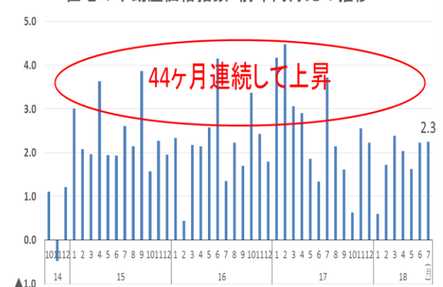
(%) 住宅の不動産価格指数 前年同月比の推移

〈問い合わせ先〉土地・建設産業局不動産市場整備課 課長補佐 藤木（内線 30-222）