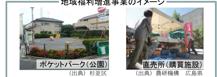
地域福利増進事業のイメージ