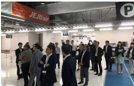
チェックインカウンター

LCCターミナルとして、低コストでありながら、機能性や快適性を備えている第3ターミナルについて、説明を受けながら、チェックインカウンター及びフードコートを視察した。