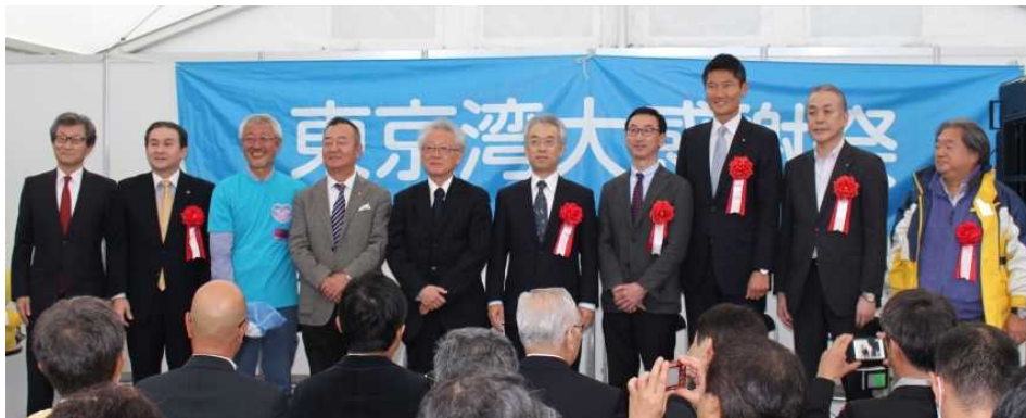
オープニングセレモニー(赤レンガ倉庫広場)