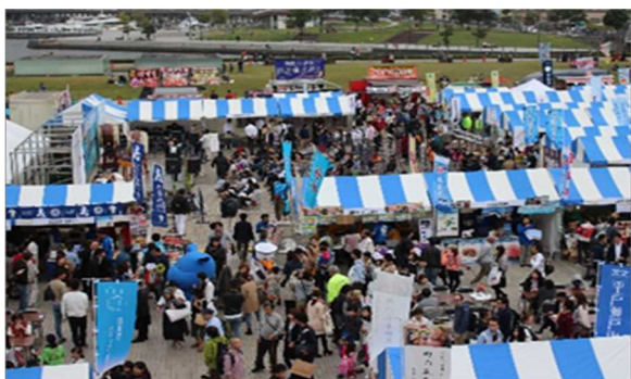
会場(赤レンガ倉庫広場)