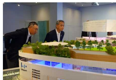
ららぽーと建設プロジェクト