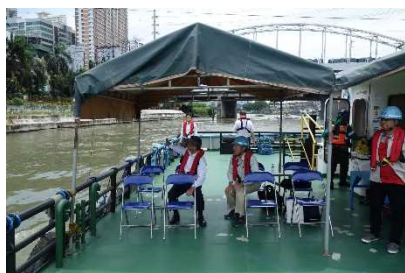
パッシング・マリキナ河川改修事業 （フェーズ3）

マニラ首都圏中心部の洪水被害軽減を図るための河川改修事業（円借款により我が国企業が受注・参画）や、今後耐震補強事業が予定される道路橋梁（我が国企業が参画見込み）を視察しました。