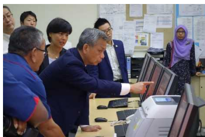
スマートトンネル（コントロールセンター）

我が国企業が手掛けた商業施設建設プロジェクトの予定地や、中心市街地の洪水対策と渋滞緩和を兼ねるスマートトンネル等を視察しました。