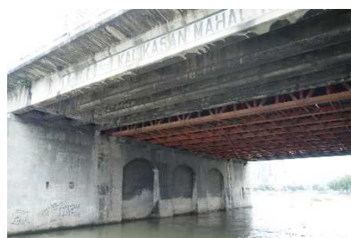
耐震補強事業が予定されるガタルペ橋