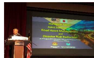
日・マレーシア道路維持管理・防災技術セミナーにおける冒頭挨拶