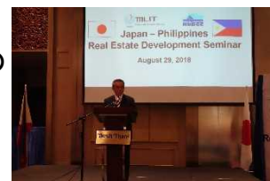
日・フィリピン不動産開発投資セミナーにおける冒頭挨拶