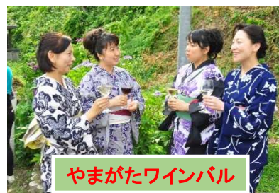
やまがたワインバル