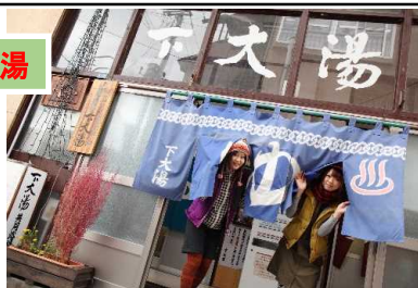
温まりの湯、美人の湯