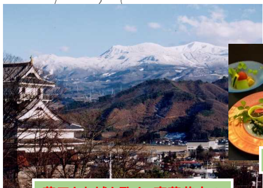
蔵王とお城と歌人・斎藤茂吉のふるさと 上山市