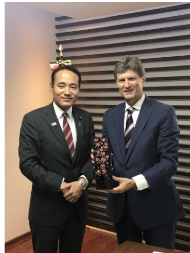
日本からのお土産(花器)をお渡しする築政務官