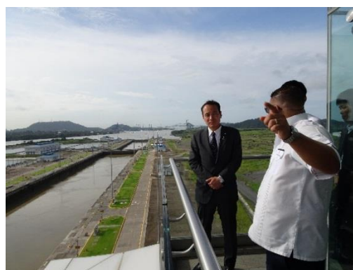
パナマ運河視察の様子