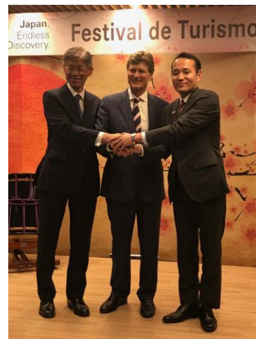
オープニングセレモニーの様子