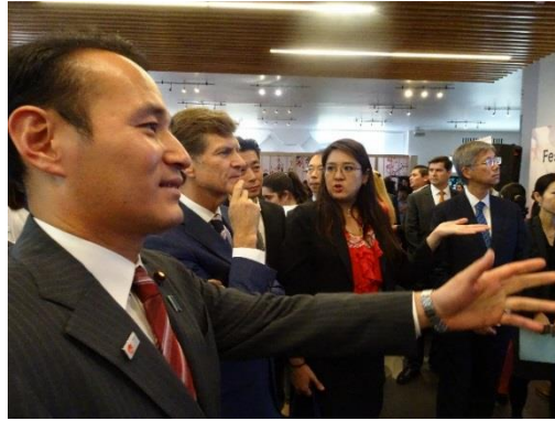
デ・ラ・マドリッド観光大臣と会場内を視察する築政務官