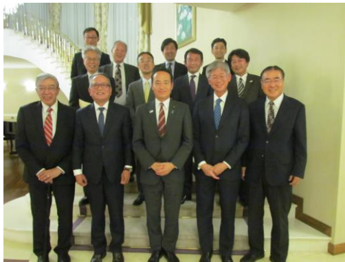
出席者と記念撮影

概要:大使公邸において、現地日系人団体である日墨協会の幹部や日系企業の関係者らと日墨の経済及び交流拡大に関する意見交換を行いました。