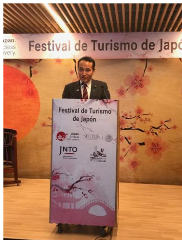
挨拶をする築政務官

概要:8 月 2 日(木)~7 日(火)の 6 日間、JNTO 主催で開催する訪日観光PRイベントのオープニングセレモニーに築政務官が出席し、冒頭、観光庁・JNTO を代表して挨拶を行いました。