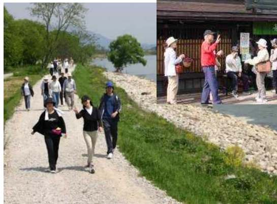
管理用通路をフットパスとして活用 (最上川)

治水上及び河川利用上の安全・安心に係る河川管理施設の整備を通じ、まちづくりと一体となった水辺整備を支援