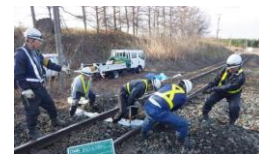
鉄道施設の設備投資や修繕