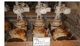
青函トンネル排水設備