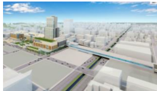
新幹線札幌駅(イメージ)