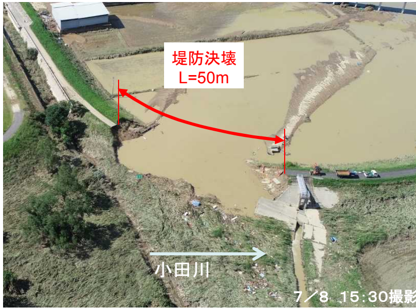
緊急対策工事状況 【被災直後】