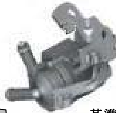
基準不適合発生箇所 ターボ チャージャー用 補助クーラント ポンプ