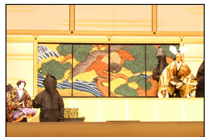
淡路人形浄瑠璃の上演