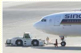
プッシュバック・トーイング (航空機の移動)