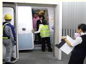
案内業務 (旅客の誘導・サポート)