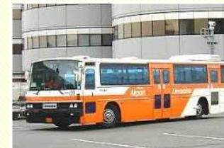
旅客輸送バス運行 (駐機場への旅客輸送)