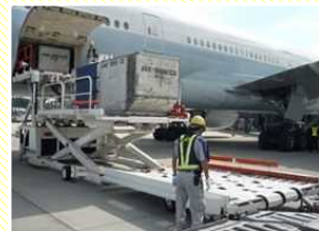
貨物の搭降載 (貨物室への積み卸し)