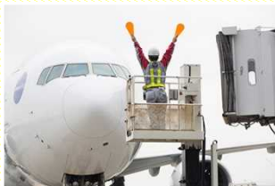
マーシャリング (航空機を駐機場に誘導)