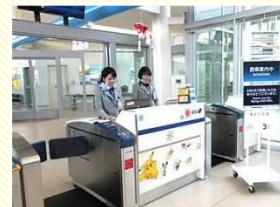
ゲート業務 (搭乗ゲートでのオペレーション)