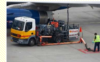
給油作業 (航空機への燃料給油)