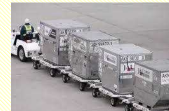
貨物の搬送 (航空機までの貨物の搬送)