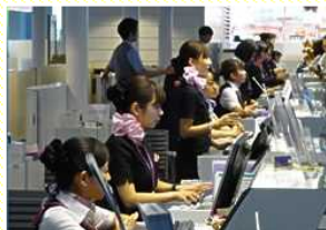
カウンター業務 (搭乗手続や手荷物の預り)