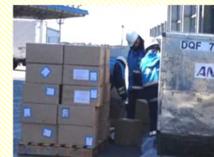
貨物の積み付け (貨物のコンテナへの搭載)