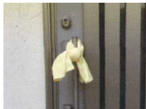
避難完了の目印にも