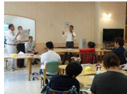
作成した手作りハザードマップを用いた訓練(静岡県藤枝市)