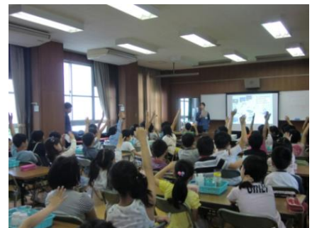
次世代を担う子どもたちに向けた上下水道訪問授業 (名古屋市)