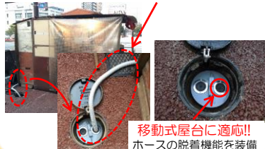
移動式屋台に適応!! ホースの脱着機能を装備

○汚水桝の設置!!→衛生面の改善 屋台のシンクから直接、ホースを挿入し 下水道へ排水できる汚水桝を設置