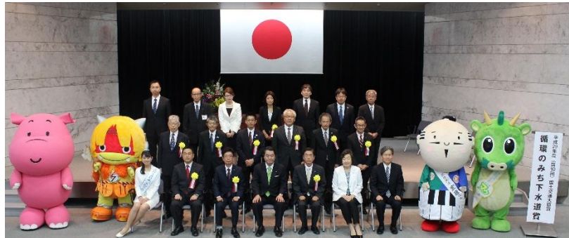
昨年度の受賞式の様子