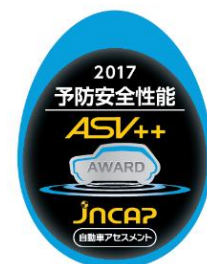
予防安全性能評価マーク