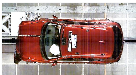
衝突安全性能評価試験の様子